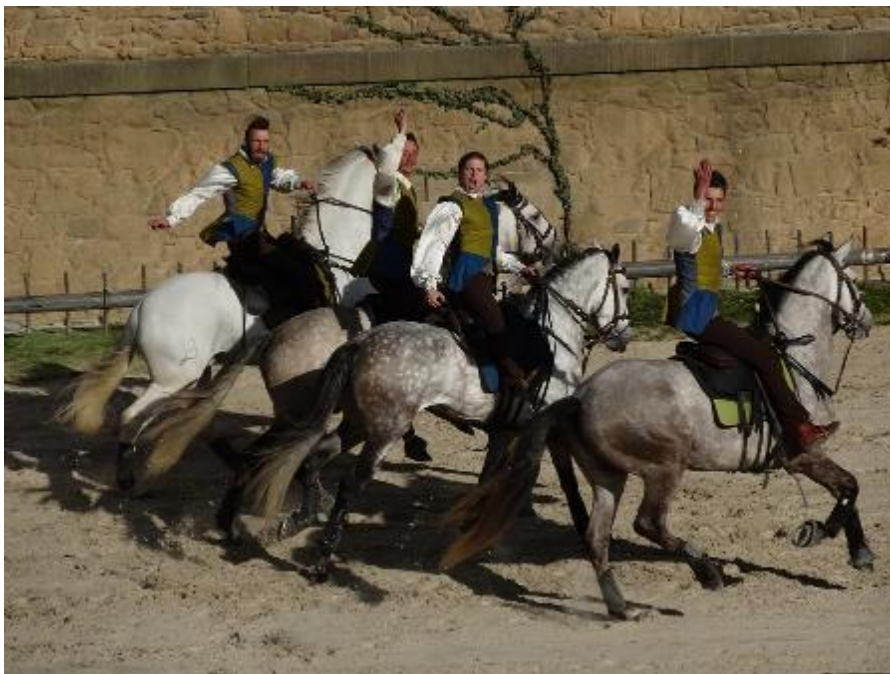
Au Puy du Fou